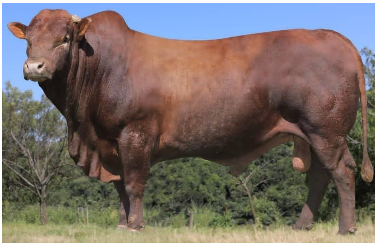
Figura 03. Touro Bonsmara apresentando os padrões da raça, como alto grau de musculatura.

A África do Sul é responsável pela análise genética dos animais no Brasil e indica os melhores animais para as centrais de reprodução e, a ABCB avalia os touros pelo o programa da associação classificando de três a cinco estrelas (Associação Brasileira de Criadores de Bonsmara, 2014).