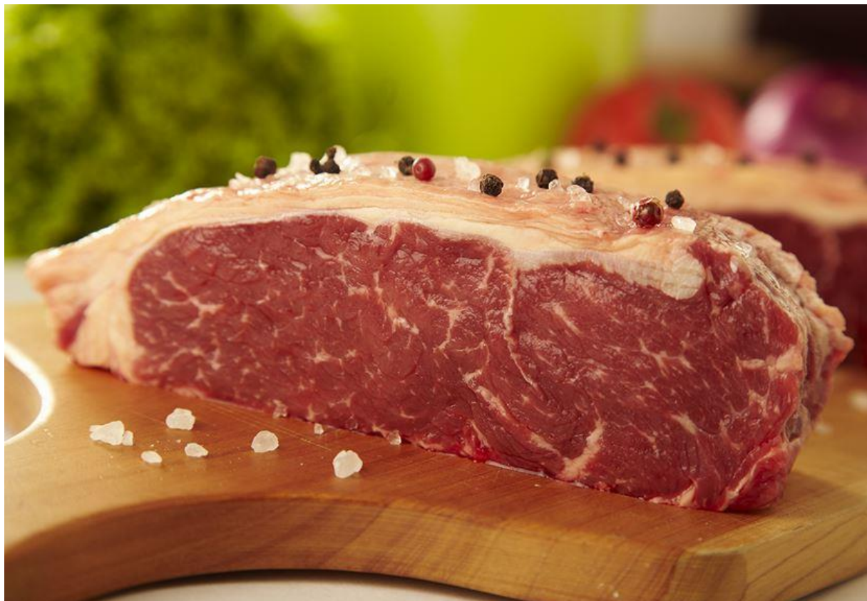
Figura 04. Carne de Bonsmara apresentando marmoreio, característico de carnes originadas de raças taurinas, o que favorece a maciez.

soja, ureia pecuária, calcário calcítico, múltiplo vitamínico, múltiplo mineral e sal comum. Os animais mestiços B1 apresentaram maior espessura de gordura de cobertura em comparação aos puros Bonsmara e Tabapuã. Tal estudo concluiu que a carne dos animais Bonsmara (Figura 04) e mestiços B1 e B2 apresentou melhor qualidade e maior maciez se comparada à dos Tabapuã (Climato et al, 2011).