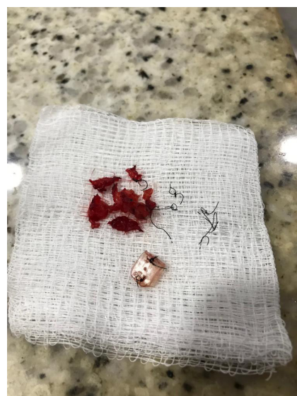
FIGURA 4 Material aloplástico encontrado em dissecação de ponta nasal, fios de sutura e fibroses.