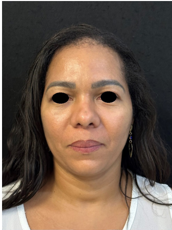
FIGURA 5 - Perfil frontal após 3 meses de rinoplastia.