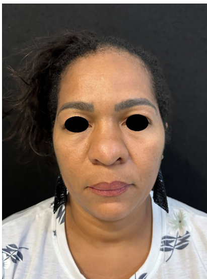
FIGURA 1 - Perfil frontal após 2 anos da rinomodelação.

O pós-operatório foi realizado com acompanhamento ambulatorial, tendo sido realizados retornos com 7, 15 e 30 dias, mantendo controle em três (Figura 5) e seis meses e, após, anualmente. Nos retornos, foram realizadas novas fotografias e analisados os resultados operatórios. Paciente nesta ocasião se apresenta satisfeita com resultado estético e com melhora completa do quadro infeccioso.